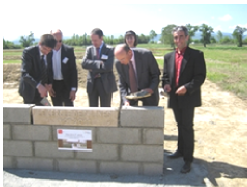
Pose de la première pierre en présence du Sous-Préfet

Les travaux de construction de la maison de retraite de 80 lits ont débuté au mois de juillet en face du magasin ASM, à proximité de la Salle Polyvalente.